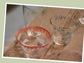
透明に変化した絵の具がなんと涼しげ。アトリエは京町家ガラス絵付け体験 (体験料4,000円)