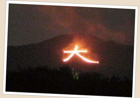
過ぎ行く夏を思いながら・・・

夜空に浮かびあがる炎夜はお待ちかね「五山の送り火」を観賞。五山を全部見たい！という息子のリクエストで、事前に予約しておいた京都タワーの展望台から眺めることに。この行事は、精霊を冥府へ送るお盆の行事。京都では、送り火とともに夏も終わりを告げると言われている。そんな話を聞くと、夜空をいろどる送り火の炎も今までとは違って見える。