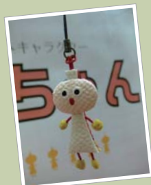
ちりめんで作られた「たわわちゃんストラップ」は、妹へのおみやげに。500円 (京都タワー)