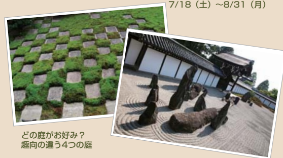
どの庭がお好み？ 趣向の違う4つの庭

東福寺は、JR東海 「そうだ 京都、行こう。」 2009年夏の キャンペーン寺院です。