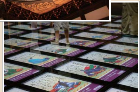
笑顔いっぱいの時雨殿