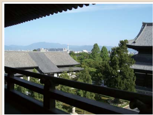
「京の夏の旅」三門特別公開は 7/18（土）～8/31（月）

続いて、方丈の庭を拝見することに。ここは斬新なデザインで知られる作庭家、重森三玲のデビュー作となった庭で、一度訪れてみたかったところ。北斗七星が砂と石で表現されていたり、市松模様があしらわれていたり、それぞれに個性的な4つの庭が次々に。