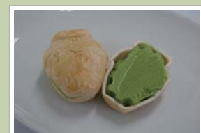
茶つぼ型のアイスモナカもおすすめ。1個140円 (大谷園茶舗)