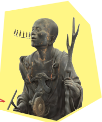
六波羅蜜寺 空也上人立像