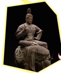
東寺 帝釈天騎象像