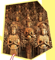
三十三間堂 千体千手観音立像