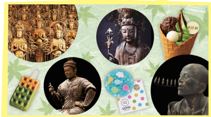
チケット内容イメージ